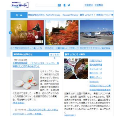
関西観光本部の公式 観光サイトでPR

その他、当本部で作成する情報誌、配布物等への 広告掲載を割引価格で実施することができます。