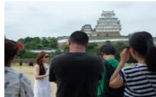
招聘ブロガーの体験+PR